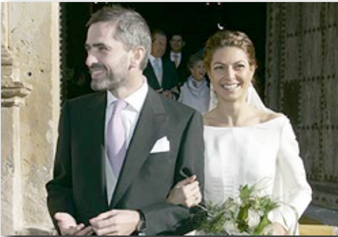
No fue el bodorrio de El Escorial pero se juntó la flor y nada del PP.

En 2003, con Zaplana como ministro de Trabajo y Asuntos Sociales, había sido nombrada Secretaria General de Asuntos Sociales. De 2004 a 2007 fue Consejera de Inmigración en la Comunidad de Madrid.